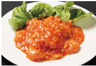
みんな大好きエビチリ 1,480円