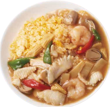
虎坊特製チャーハン 980円