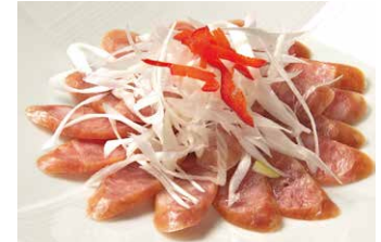
中華風ソーセージ 480円