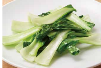
青菜のサッと炒め 830円